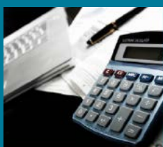
AKTUELLE BILDUNGSGÄNGE BEISPIELHAFT

Die Bildungsgänge an Berufskollegs ermöglichen alle allgemeinbildende Schulabschlüsse der Sekundarstufe I und der Sekundarstufe II. Je nach Bildungsgang ist es möglich einen höheren Abschluss zu erreichen.