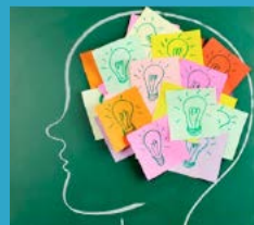
DIE BILDUNGSGÄNGE IM ÜBERBLICK

Berufskollegs kombinieren allgemeine und berufliche Bildung. Die Entscheidung für ein Berufskolleg ist daher immer verbunden mit der Frage "Welche berufliche Richtung interessiert mich im Augenblick?" Die Übersicht der Kölner Berufskollegs hilft weiter.