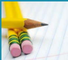
BERUFSKOLLEGS AUF EINEN BLICK

Berufskollegs kombinieren allgemeine und berufliche Bildung. Die Entscheidung für ein Berufskolleg ist daher immer verbunden mit der Frage "Welche berufliche Richtung interessiert mich im Augenblick?" Die Übersicht der Kölner Berufskollegs hilft weiter.