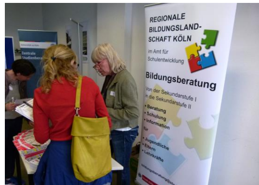
Eindrücke von dem Gesamt-StuBO-Arbeitstreffen 2017